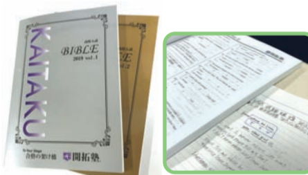
開拓塾は全てオリジナルテキスト 定期テスト対策もこれでバッチリ