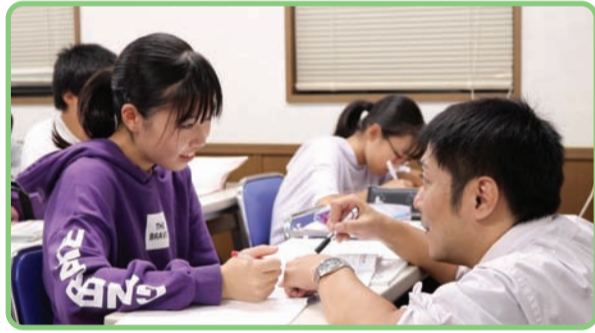
生徒一人ひとりに寄り添い続けます