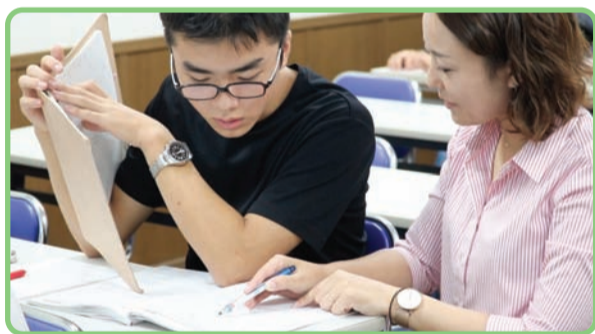
分かりやすく、一人ひとり丁寧に