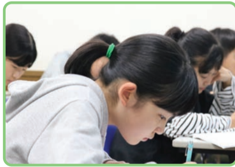
真剣に取り組むカイトク生