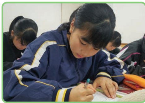
積極的に取り組むカイトク生