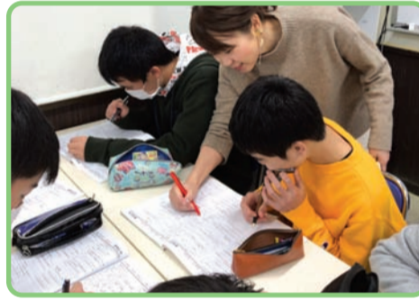
定期テスト前は自習教室を徹底開放