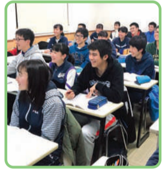
明るいクラス作りを常に目指します!